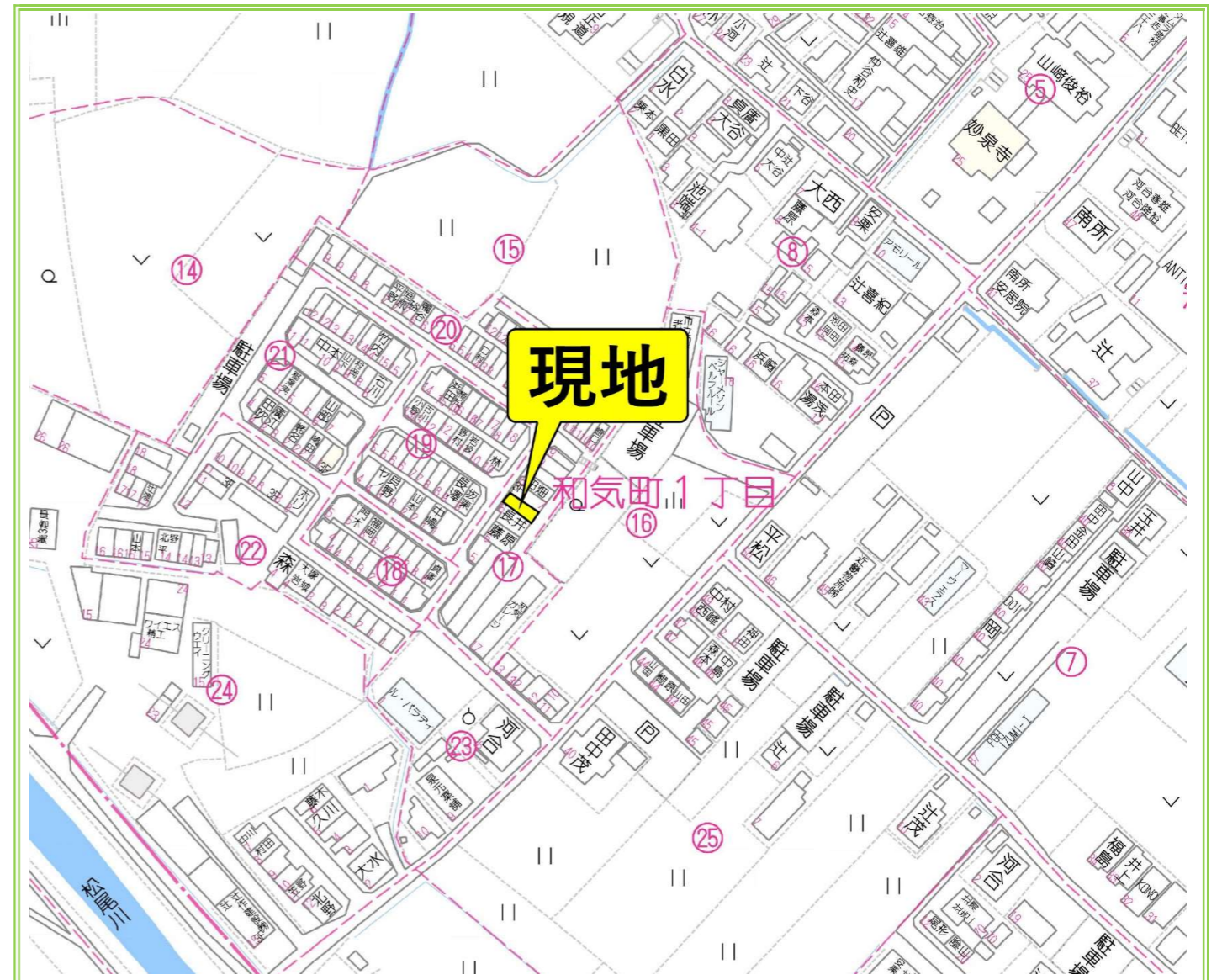
【ナビ検索住所】和泉市和気町1丁目17-7