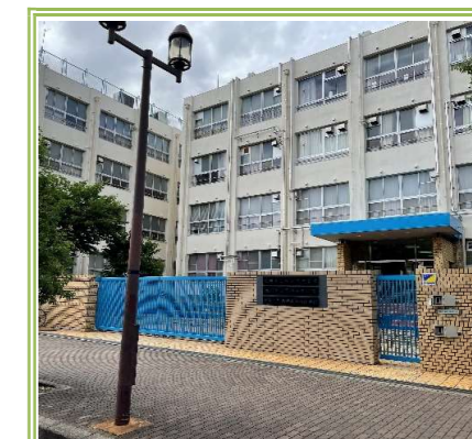
咲洲みなみ小中一貫校 ... 270m