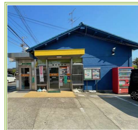
⑦ 福泉郵便局 … 約 350m