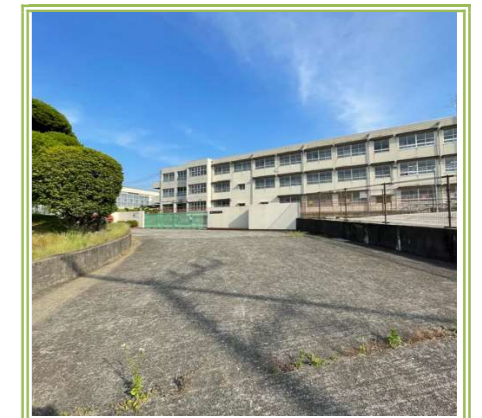
福泉中学校 … 約 1000m