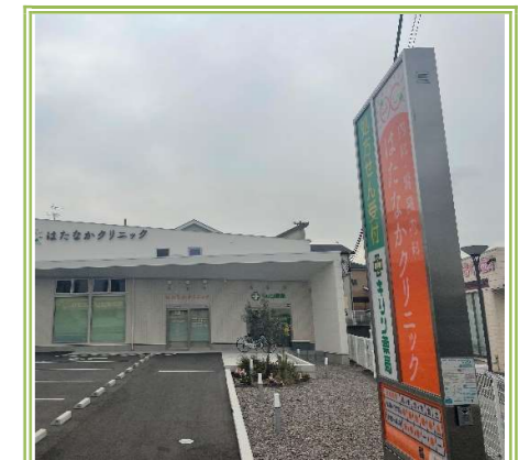
⑥ はたなかクリニック … 約 100m