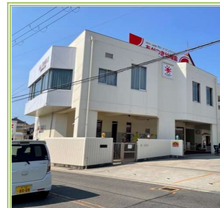
③ あかつき幼稚園 … 約 400m