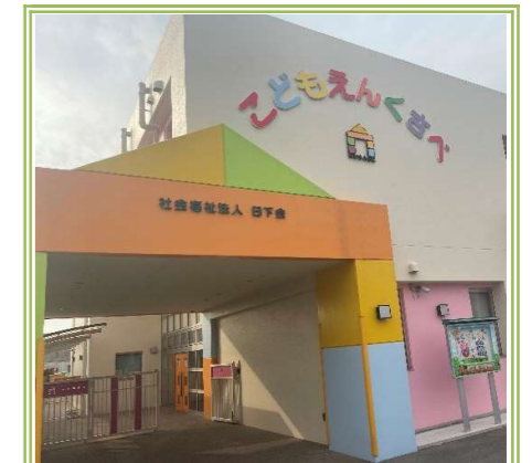
② こども園くさべ … 約 400m