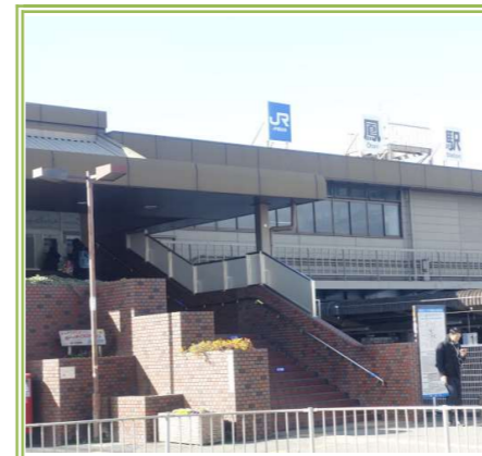
JR阪和線「鳳」駅 … 約 1700m