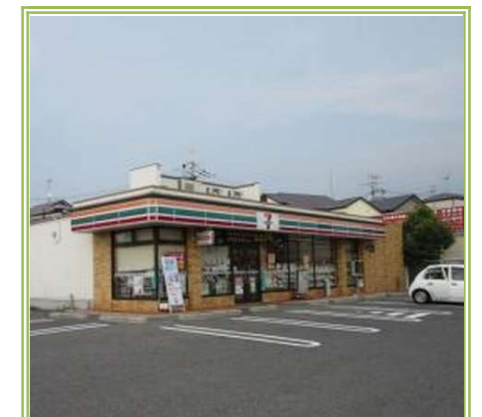
⑨ セブンイレブン 高石取石7丁目店 … 約 700m