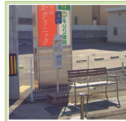
①「石橋」バス停 … 約 110m