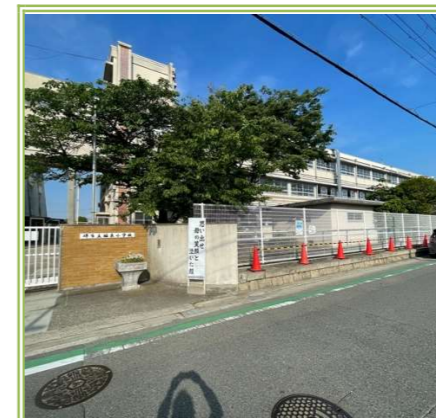
福泉小学校 … 約 1000m