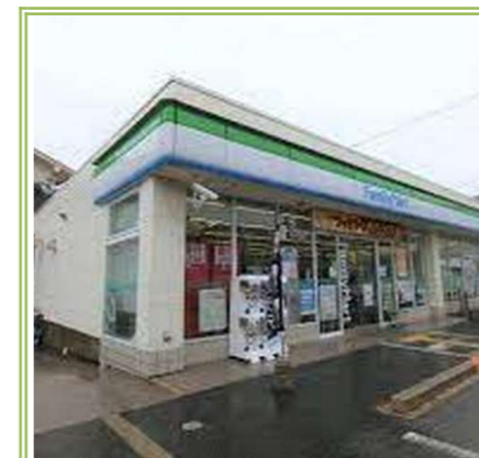
⑧ ファミリーマート 堺草部店 … 約 500m