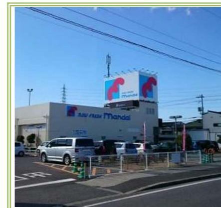
④ 万代 堺草部店 … 約 300m