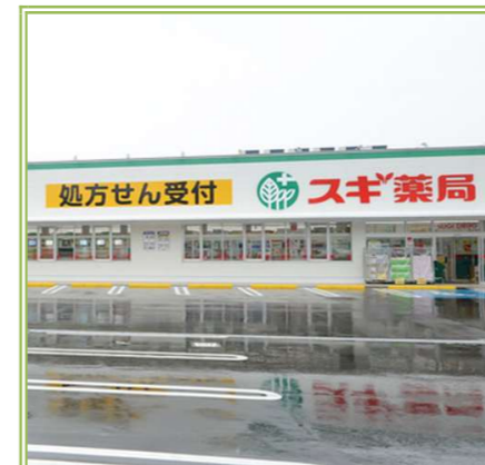
⑤ スギ薬局 取石店 … 約 750m