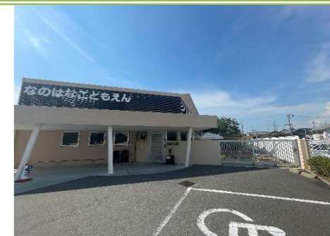
① 菜の花こども園 … 約 850m