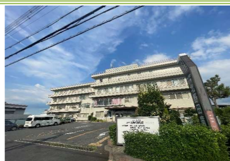
⑥ 田仲北野田病院 … 約 1200m