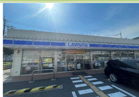
⑧ ローソン堺丈六店 … 約 300m