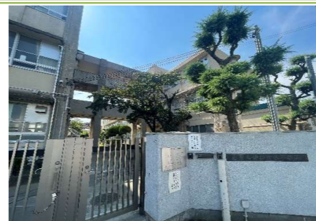
② 登美丘東小学校 … 約 240m