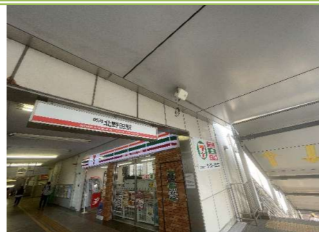
南海高野線「北野田」駅 … 約 850m