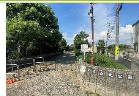
⑦ 登美丘北公園 … 約 500m