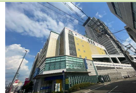
⑤ ベルヒル北野田 … 約 750m