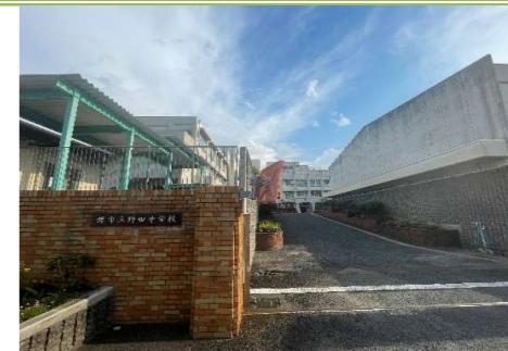
③ 野田中学校 … 約 1600m