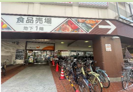
④ ダイエー北野田店 … 約 900m