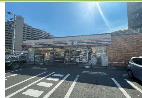
⑨ セブンイレブン堺登美丘東店 … 約 400m