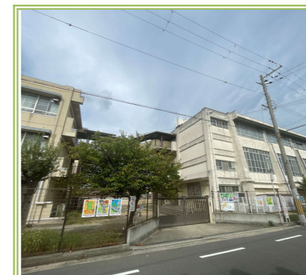
浜寺石津小学校 … 700m