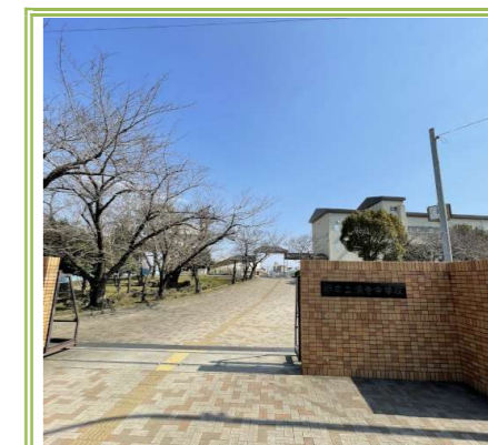
浜寺中学校 … 1700m