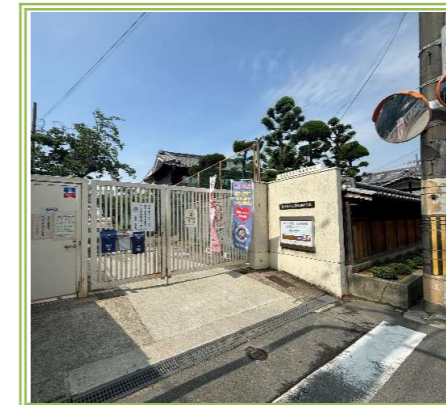
岩田西小学校 … 450m