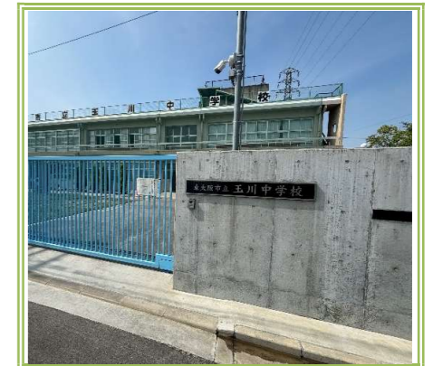
玉川中学校 … 1400m