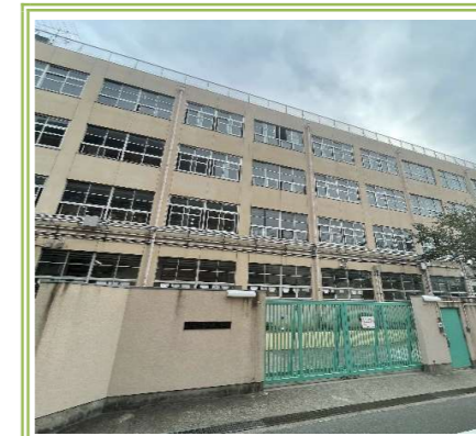
西堤小学校 … 1000m