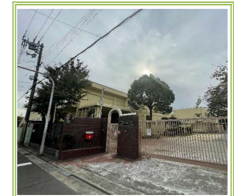
新喜多中学校 … 1100m