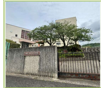
鳥取東中学校 … 2100m