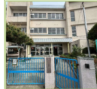
東鳥取小学校 … 550m