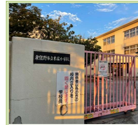
末広小学校 … 1600m