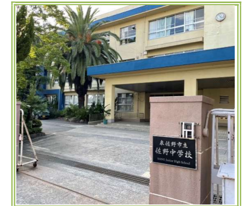
佐野中学校 … 900m