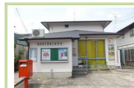
⑬富田林 久野喜台郵便局 … 約 400m