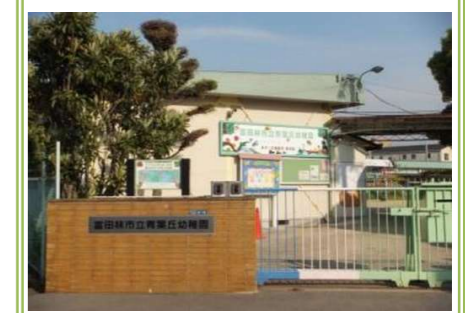
②青葉丘幼稚園 … 約 550m