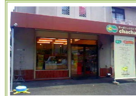
⑦オーガニックストア chacha 藤沢台店 … 約 600m