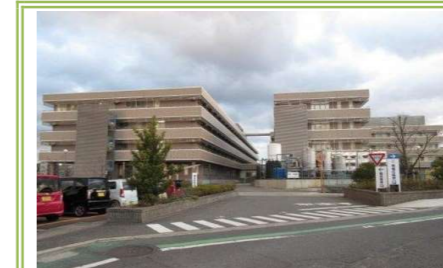
⑩青葉丘病院 … 約 950m