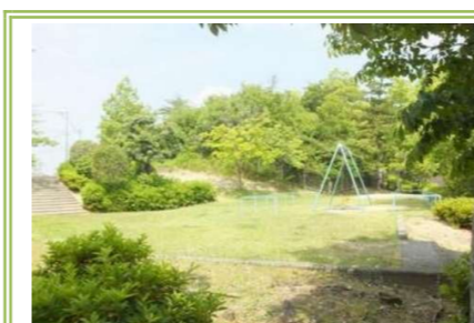
⑫久野喜台4号公園 … 約 400m