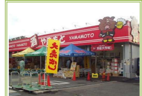
⑧地域食品センター やまもと … 約 750m