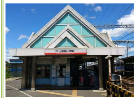
南海高野線 「大阪狭山市」駅 … 約 600m

大阪府知事 (8) 第 41432 号 さくらホーム株式会社 〒592-0012 大阪府高石市西取石 6 丁目 3 番 9 号 TEL072-265-6701 FAX072-265-6702