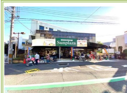
⑥サンプラザ 狭山店 … 約 500m