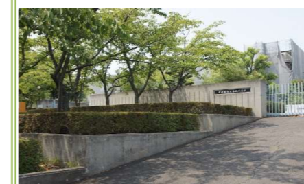
④葛城中学校 … 約 750m