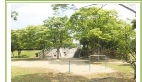
⑪藤沢台1号緑地 … 約 300m