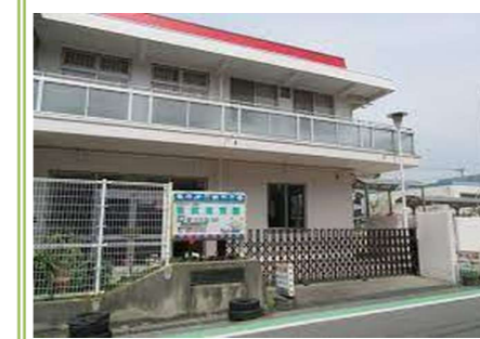
①葛城保育園 … 約 800m