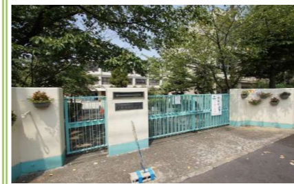
③久野喜台小学校 … 約 500m