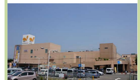
⑤イオン金剛店 … 約 1100m