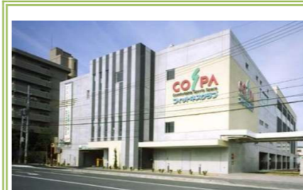
⑨フィットネスクラブ コ・スパ 金剛 … 約 1000m