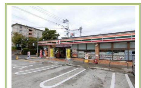
セブンイレブン 富田林久野喜台店 … 約 550m