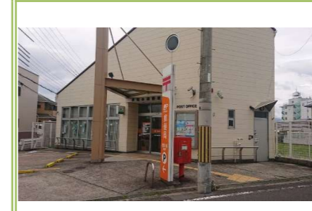
⑬貝塚小瀬郵便局 … 約 450m