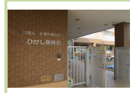
①ひがし保育園 … 約 1100m