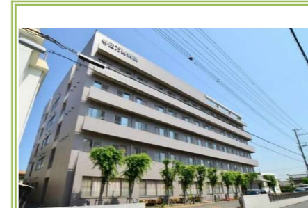
⑩寺田萬寿病院 … 約 600m