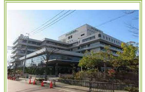
⑪市立貝塚病院 … 約 1200m