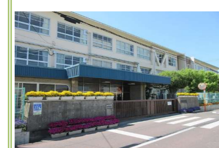
④第二中学校 … 約 1000m