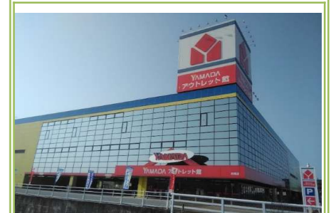
⑧ヤマダデンキアウトレット貝塚店 … 約 650m