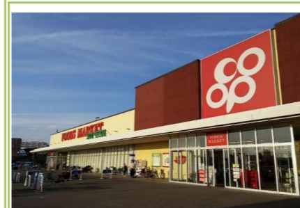
⑥コープ貝塚 … 約 1400m