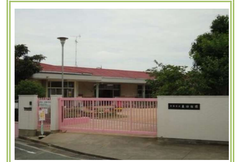
②東幼稚園 … 約 1000m