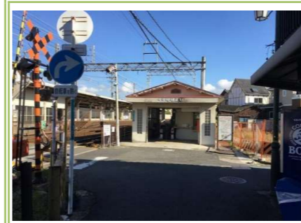
南海本線「蛸地蔵」駅 … 約 750m

大阪府知事(8)第41432号 さくらホーム株式会社 〒592-0012 大阪府高石市西取石6丁目3番9号 TEL072-265-6701 FAX072-265-6702