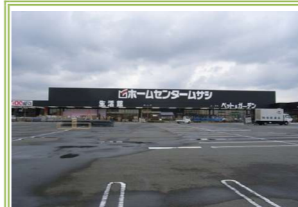
⑨ホームセンタームサシ貝塚店 … 約 1100m