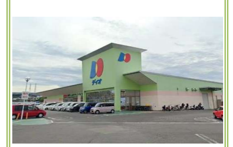
⑤デオ貝塚店 … 約 700m