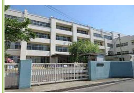
③東小学校 … 約 450m