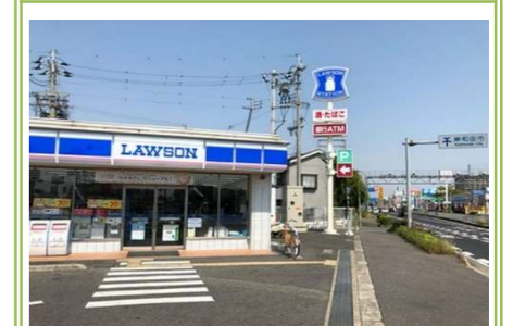
ローソン 貝塚久保店 … 約 950m