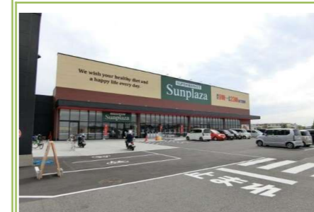
⑦サンプラザ東貝塚店 … 約 1100m