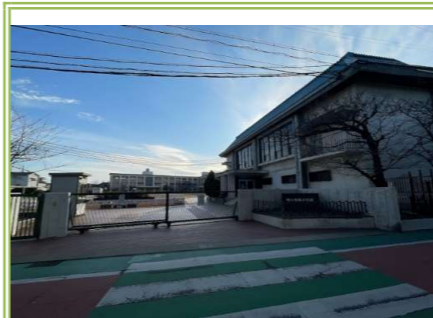
3 忠岡小学校 … 約 950m