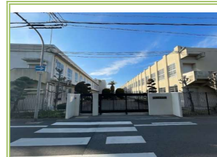
4 忠岡中学校 … 約 1400m