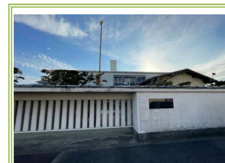
8 正木美術館 … 約 450m