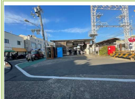
南海本線「忠岡」駅 … 約 1300m

大阪府知事 (8) 第 41432 号 さくらホーム株式会社 〒592-0012 大阪府高石市西取石 6 丁目 3 番 9 号 TEL072-265-6701 FAX072-265-6702