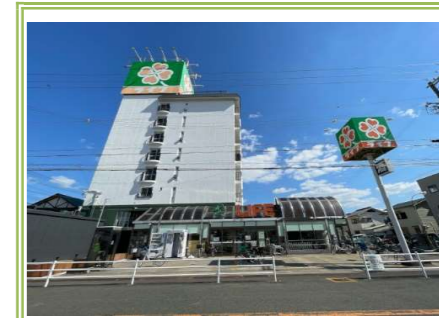
5 ライフ忠岡店 … 約 1400m