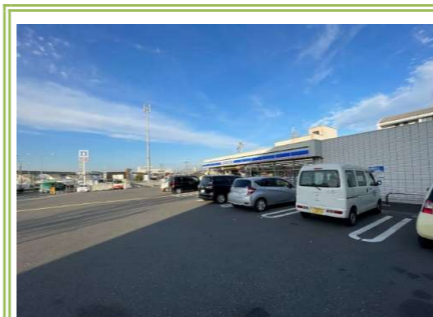
12 ローソン忠岡中店 … 約 450m