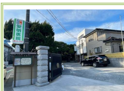
9 安明医院 … 約 900m