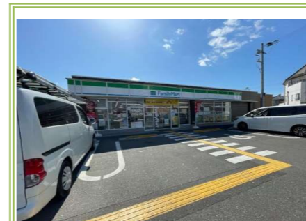
13 ファミリーマート小浦忠岡北店 … 約 800m