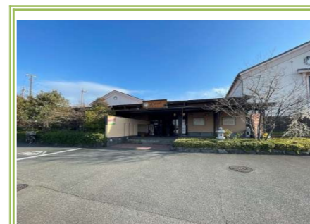
7 湯源郷太平のゆ忠岡店 … 約 1100m