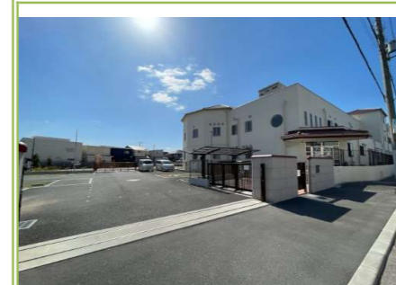
1 ピープル忠岡チャイルドスクール … 約 550m