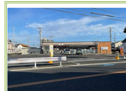
14 セブンイレブン忠岡中1丁目店 … 約 1000m