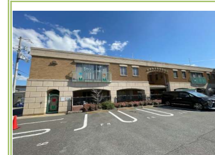
2 チューリップ保育園 … 約 1200m