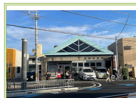
10 忠岡郵便局 … 約 1100m