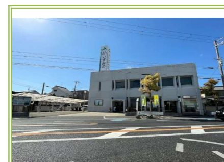
11 JAいずみの忠岡支店 … 約 1100m