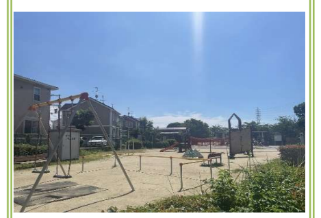
8 取石公園 … 約 500m