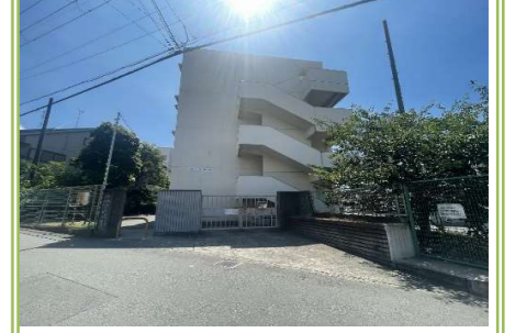
2 高石市立取石小学校 … 約 50m