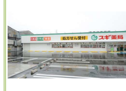
7 スギ薬局取石店 … 約 1100m