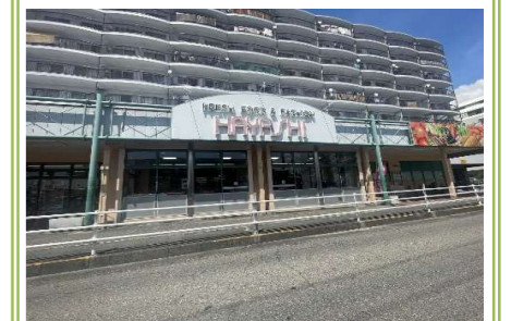
5 スーパーはやし富木店 … 約 450m