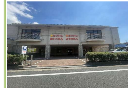
1 取石認定こども園 … 約 220m