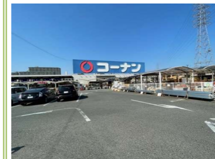
6 コーナン高石富木店 … 約 1000m