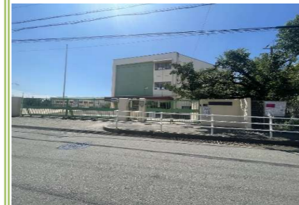
3 高石市立取石中学校 … 約 100m