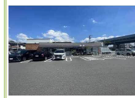
10 セブンイレブン高石取石6丁目店 … 約 850m