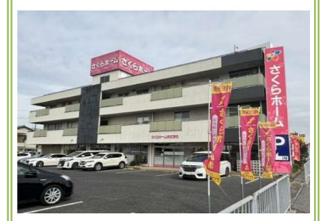
11 さくらホーム … 約 700m