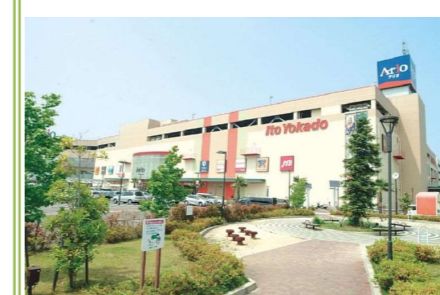
4 アリオ鳳 … 約 1400m