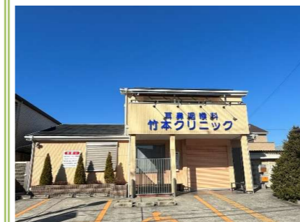
9 竹本クリニック … 約 650m