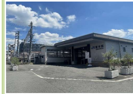
JR阪和線「富木」駅 … 約 700m

大阪府知事 (8) 第 41432 号 さくらホーム株式会社 〒592-0012 大阪府高石市西取石 6 丁目 3 番 9 号 TEL072-265-6701 FAX072-265-6702