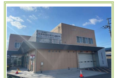
④上之郷コミュニティセンター … 300