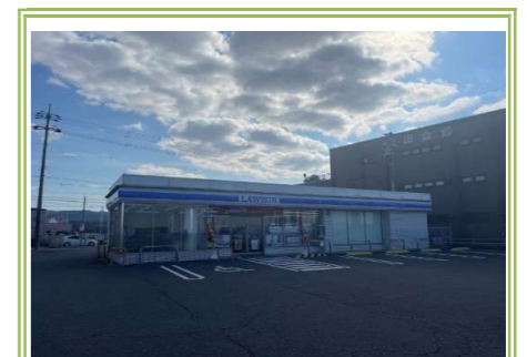
⑧ローソン泉佐野長滝店 … 800