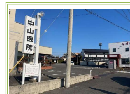
中山医院 … 1600