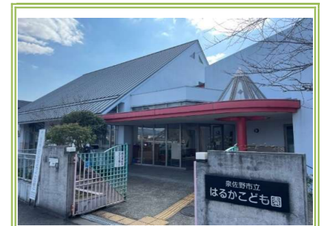
①はるかこども園 … 650