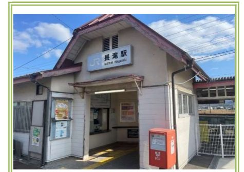
JR阪和線「長滝」駅 … 850