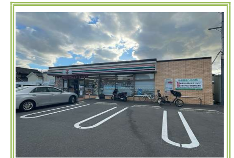
セブンイレブン 泉大津下之町店 … 約 290m