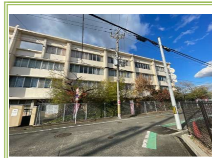
③ 我小学校 … 約 140m