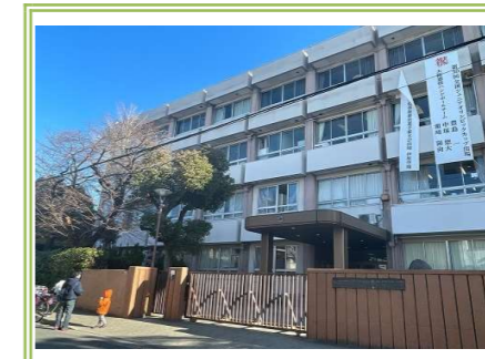
④ 誠風中学校 … 約 180m