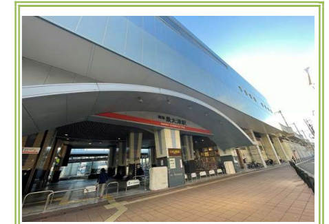
南海本線「泉大津」駅 … 約 100m