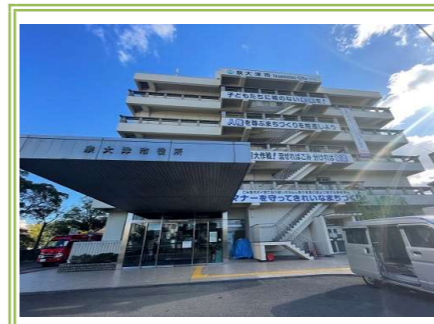
⑧ 泉大津市役所 … 約 1500m