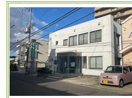
⑨ かやのき内科医院 … 約 250m