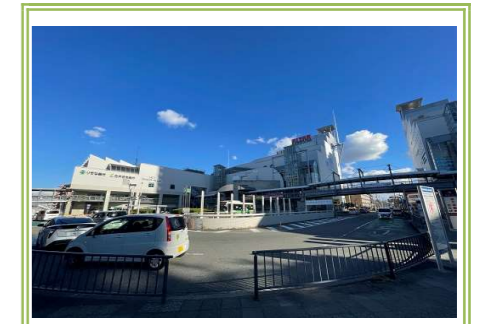
⑤ アルザタウン 泉大津 … 約 130m